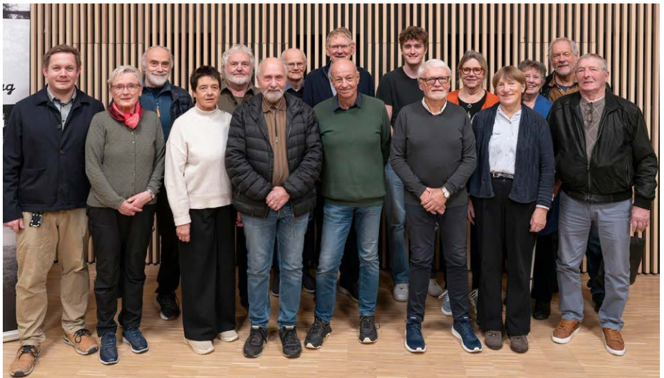
Her er mange av artikkelforfatterne til årsskrift 2025 på rad og rekke.